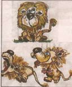
Saulės sukurti animaciniai personažai

jau būdavo neberekalingi. Indai yra atėję iš vieno rinkinio - tikri restoraniniai: didelės sunkios akmeninės baltos lėkštės, kurios man labai patinka. Visi pagrindiniai indai yra balti, o patiekalams turiu kalną unikalų spalvotų keramikinių dubenėlių, daug kiškos keramikos, į kurių dedu patiekalą. Tiek staltiesės, tiek patalynė patinka vienspalvės: baltos, šokoladinės, žalsvos, mėlynos,