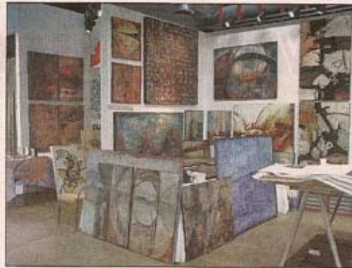
Saulės darbų instaliacija vienoje iš parodų

Mano užsakovai yra „Arron Brothers“, „Linen and Things“, „Bed Bath and Beyond“ ir pan.